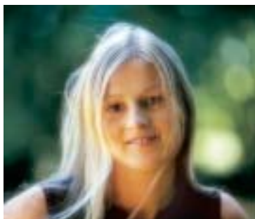
Filtre diffuseur B+W

Tous les filtres de trucage B+W sont proposés avec des variantes produisant des effets différenciés. Tout particulièrement en ce qui concerne les portraits, l'effet de flou artistique choisi peut s'avérer très important. L'offre va de l'effet à peine perceptible jusqu'à la nébulosité caractérisée avec des lumières accentuées. On peut trouver ainsi pour chaque sujet, le filtre correspondant à son choix personnel. Il est évidemment possible de combiner entre eux différents filtres de trucage et de découvrir des effets surprenants.