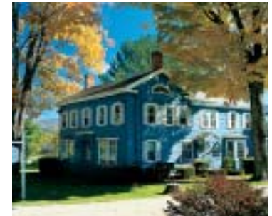
avec filtre polarisant

saturées. Pour la photographie en nature ou de paysage, le filtre polarisant apporte un ciel d'un bleu intense, des nuages d'un blanc resplendissant et des plantes aux couleurs vives. Il est également idéal pour les prises de vues avec des plans d'eau. Leurs multiples applications concernent tout autant la photo-