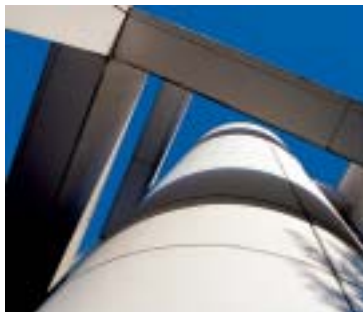
avec filtre polarisant

ne peut être reconstituée avec l'ordinateur. Les filtres Digital Pro ont un diamètre de monture et un design spécialement accordés aux appareils numériques et aux caméscopes. Les nouvelles montures chromées sont en totale harmonie avec les tendances claires des appareils numériques.