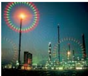
Filtre spectral B+W