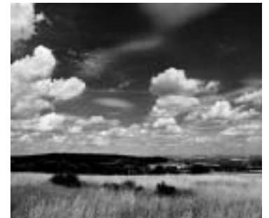
avec filtre rouge 090