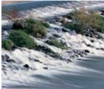
avec filtre gris 106

Les filtres correcteurs de lumière permettent de fines corrections de couleur, les filtres désignés color correction sont utilisés pour des interventions minimales ou sérieuses dans le rendu chromatique d'un film, pouvant même aller jusqu'à des effets calculés de dépaysement. Parfois c'est uniquement la sensibilité du film qui est un peu trop élevée pour faire apparaître des effets de mouvement ou pour une faible profondeur de champ avec un diaphragme le plus ouvert possible. Les filtres gris et neutre B+W de force variée permettent de pallier à ces situations.