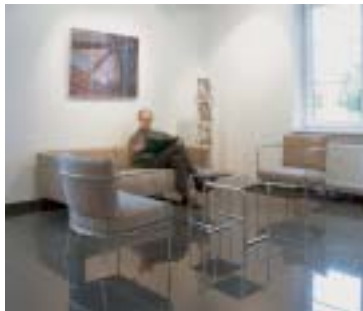
avec filtre de conversion KB12