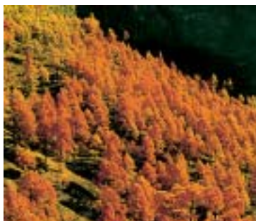
Filtre infrarouge B+W