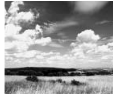
avec filtre orange 040