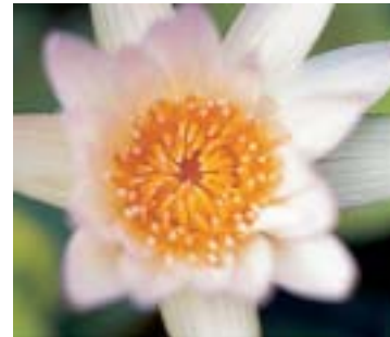
avec bonnette NL4

et, comme les filtres, elles sont petites et légères. Elles font office de lentilles convergentes, qui réduisent la distance focale, à tirage optique égal, tout en augmentant l'échelle de reproduction. Elles permettent ainsi d'obtenir facilement en plein format des fleurs, des insectes, des pièces de monnaie ou des timbres.